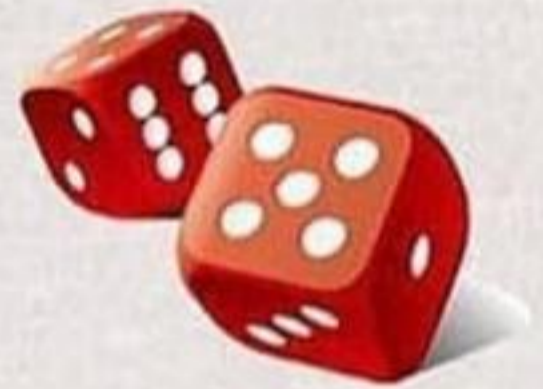
Jogos de azar