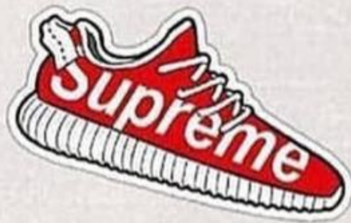
Roupas de marca